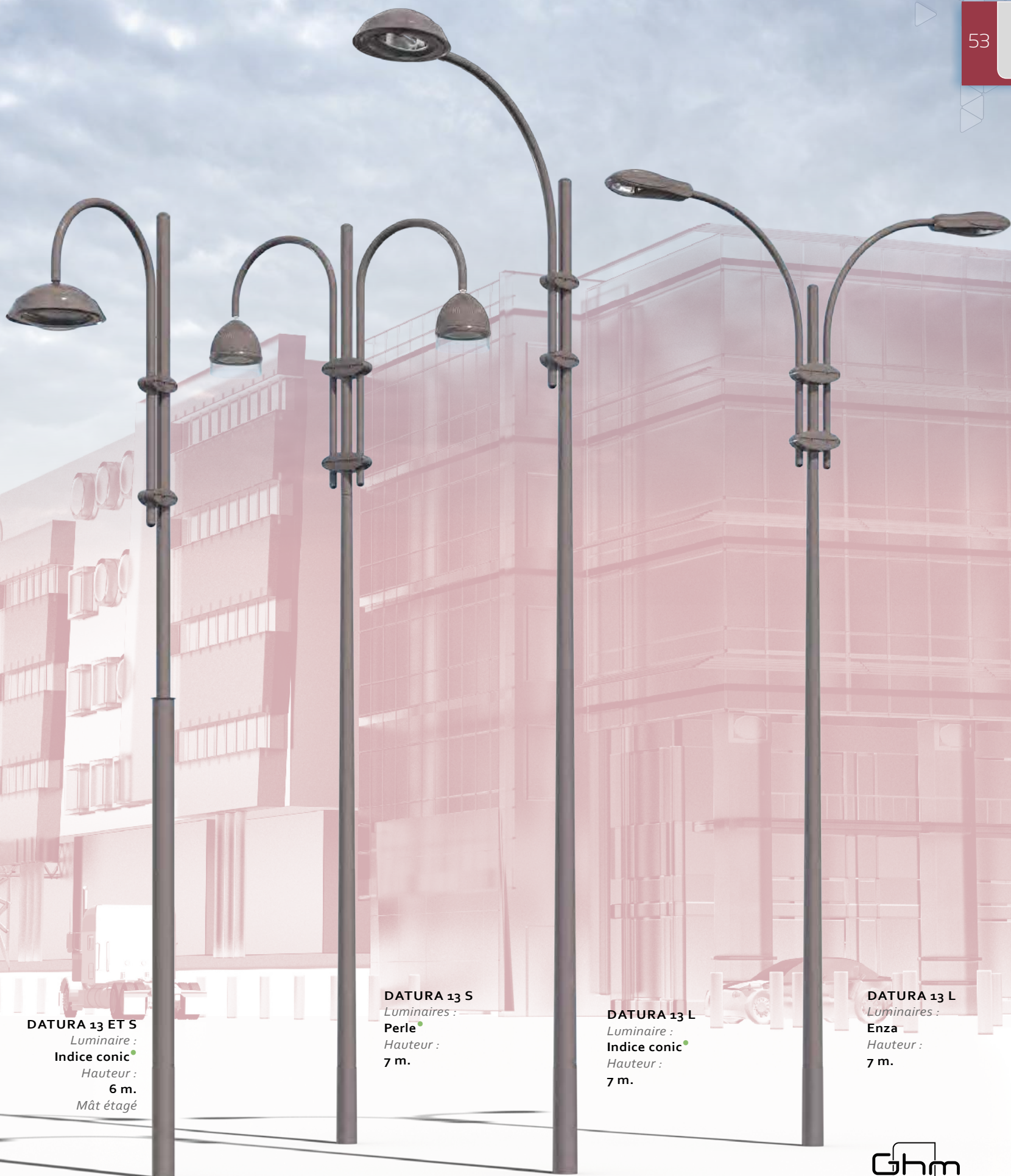
DATURA 13 ET S Luminaire : Indice conic Hauteur : 6 m. Mât étagé